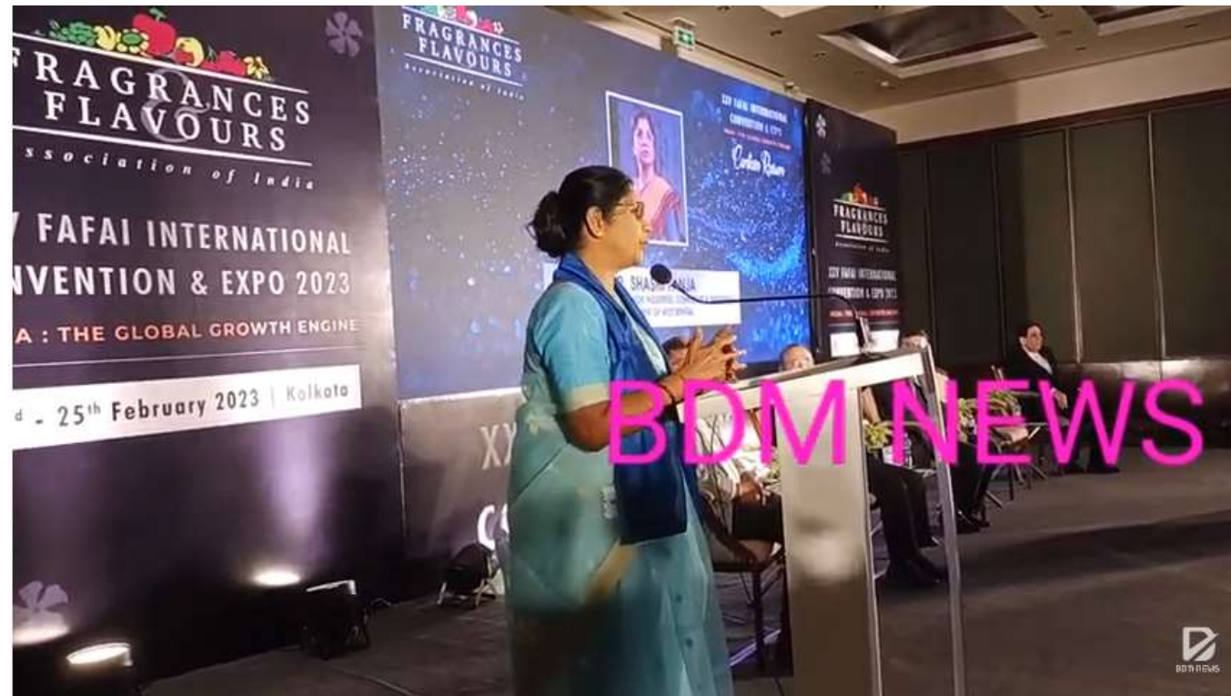
FFAI to Celebrate Silver Jubilee with First Kolkata Convention.

Link- https://www.youtube.com/watch?v=VKEFSKiLVZg