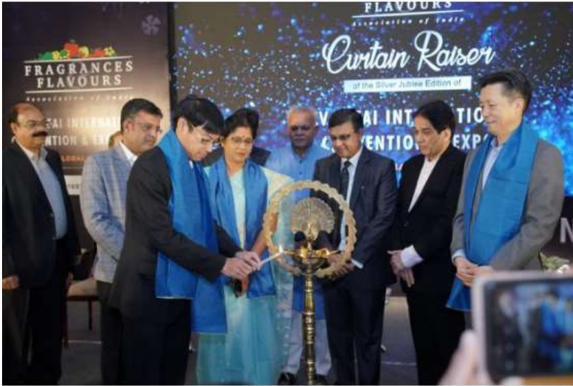
The Fragrances and Flavours Association of India (FAFAI) to Celebrate Silver Jubilee with First Kolkata Convention

FAFAI is the nation's apex body in the field of Fragrances, Flavours, Aroma chemicals, Natural Oils and their ancillaries. Started by a group of connoisseurs in 1949, their goal has been to create a sense of unity amongst the traders and dealers in the industry. This has allowed the Fragrances and Flavours Association of India to grow into a national association with close to 900 current members.